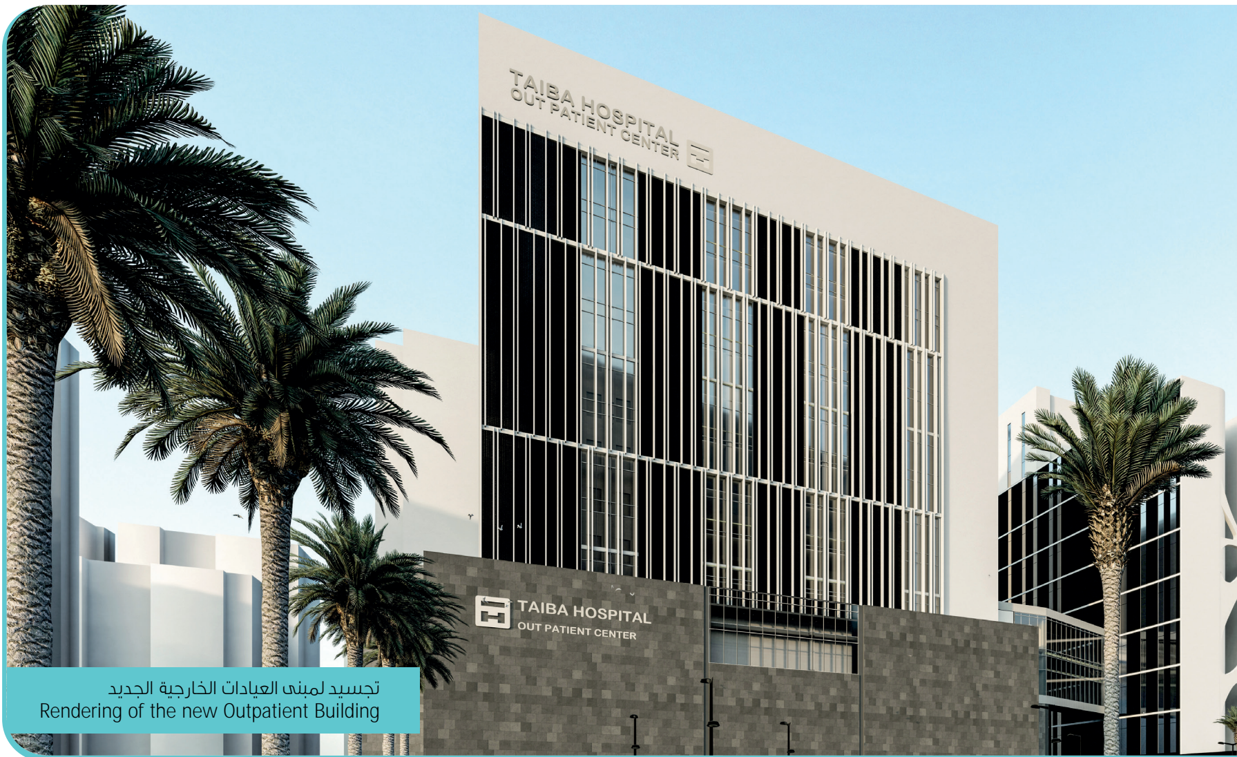
تجسيد لمبنى العيادات الخارجية الجديد Rendering of the new Outpatient Building